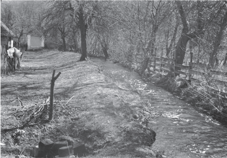
Слика 09. Јаз за довод воде до воденице село Годљево