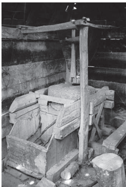
Слика 12. Воденички камен и констїрукција млина, село Маковишїе