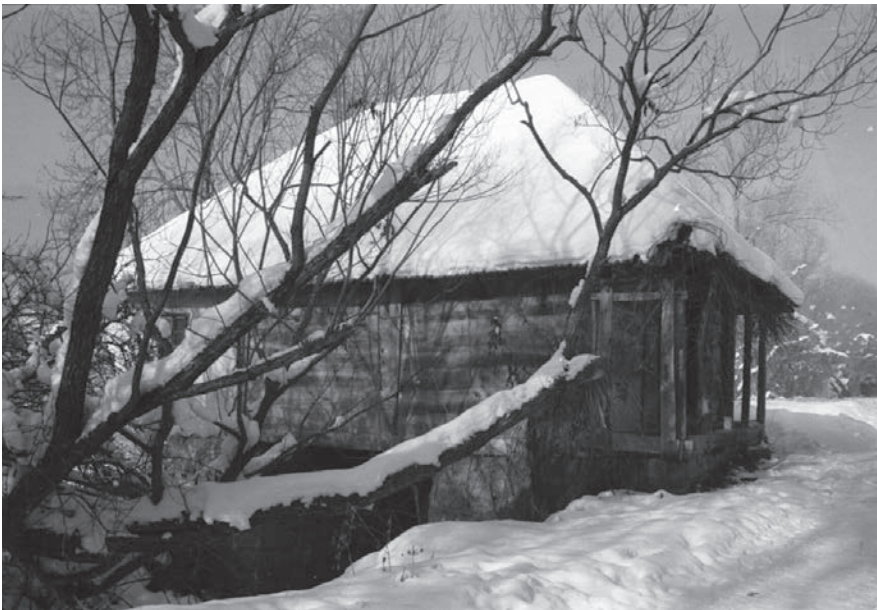
Слика 10. Воденица ђиремом на реци Скрајеж селу Косјерић