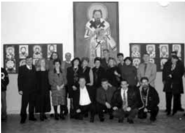
Наставнички колектив 2001/02.

вишом, 3 са средњом школском спремом, један је квалификовани а пет неквалификованих радника.