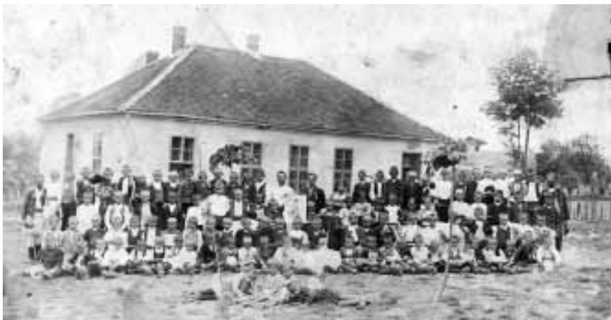
92 Баби и учитељи пред старом школом Фамилијази

Поступајући по овом закону Попучанци су после образовања школе у свом селу све редовније слали децу у њу. Временом број ученика се повећавао, али је и варирао. Обично у годинама непосредно после ратова растао је број уписаних ученика, док је у годинама када су за упис стизала деца рођена у ра-