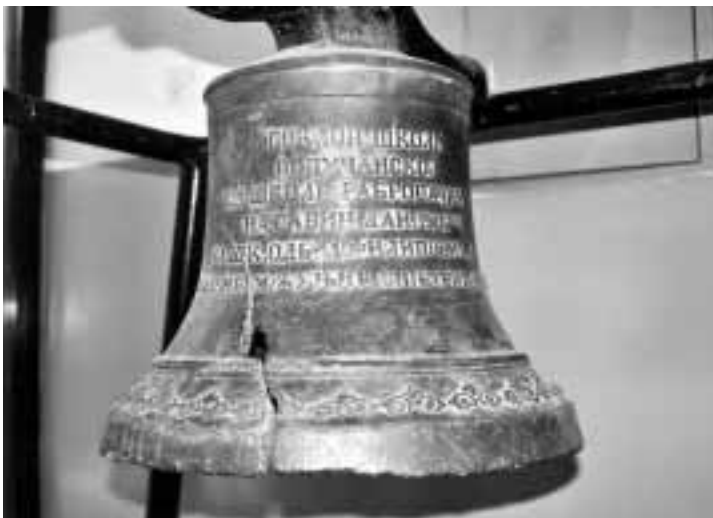
Старо школско звоно

реткост, то су на звук овог звона мештани започињали или завршавали многе значајне и прецизне послове.