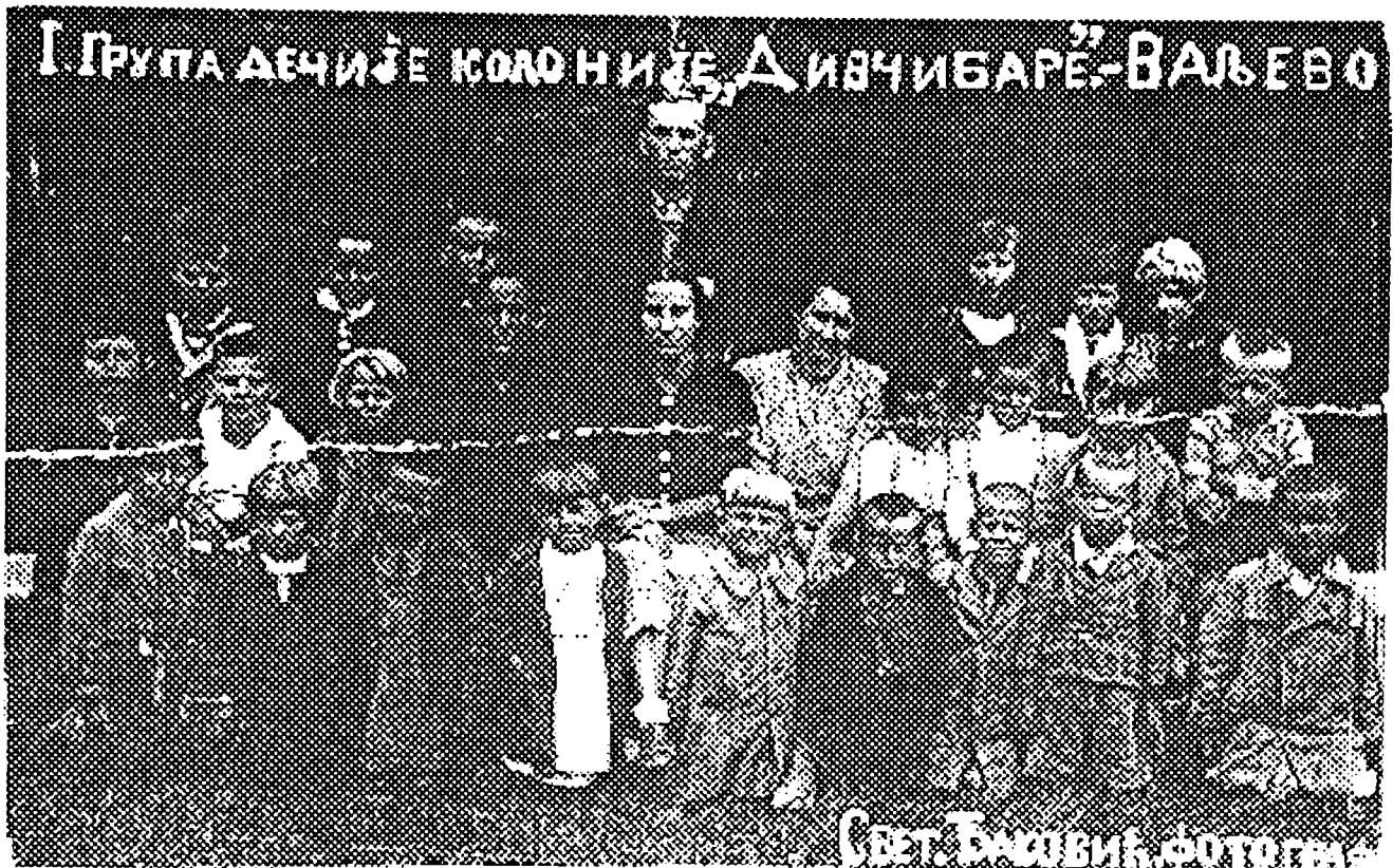
Прва група Дечје колоније „Дивчибаре”, 1934. године

зимовање, она су и у време ферија остајала у својим приземним кућицама, на прашњавим и загушљивим улицама и оптерећена разним бригама.