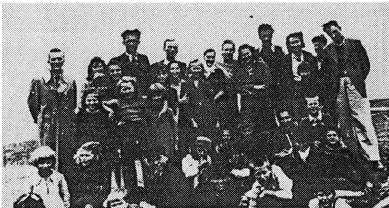
Дечја група „Будућност” на Дивчибарама 1940. године