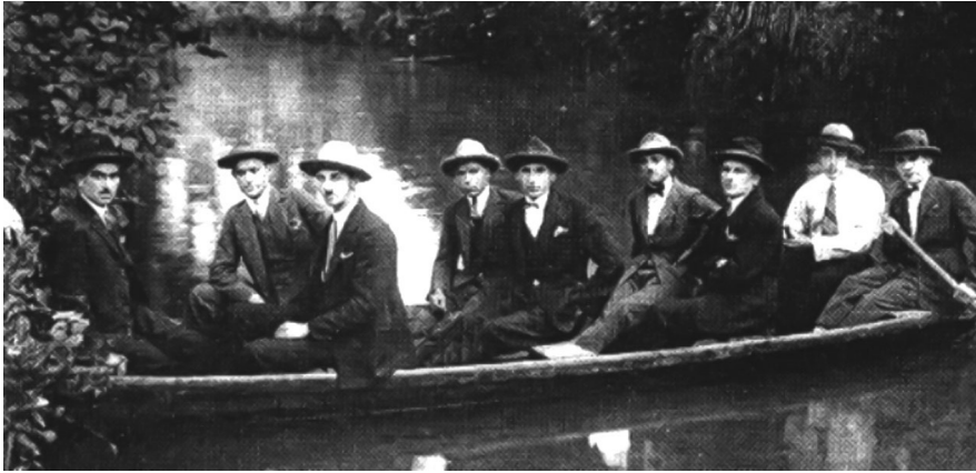
Чамци на Обници