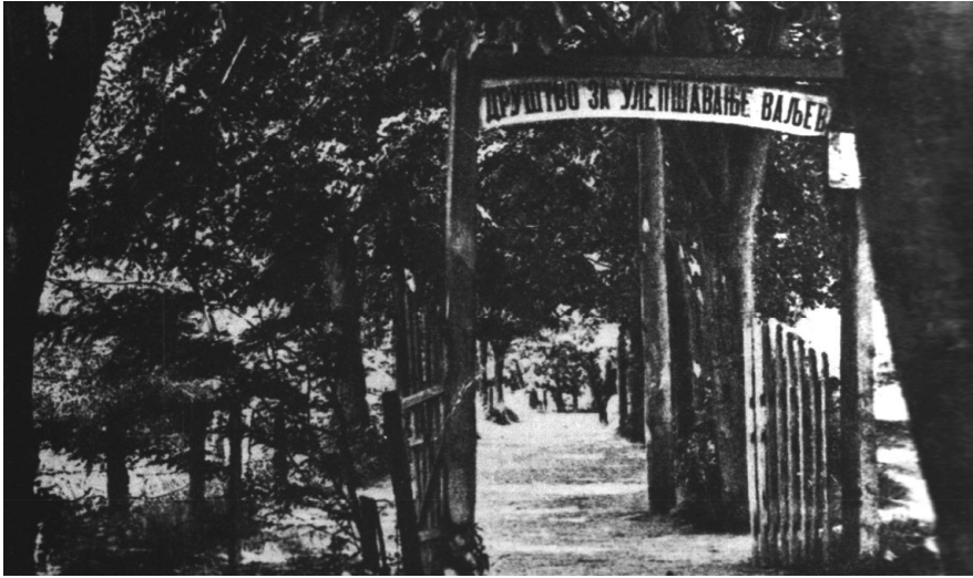
Капија Друштва за улепшавање Ваљева

смо да то није тачно јер је Друштво за улепшавање Врачара у Београду, из потребе за бољим и квалитетнијим животом, настало још 1884. године, 10 па не искључујемо и могућност да је баш оно било узор за оснивање овог друштва.