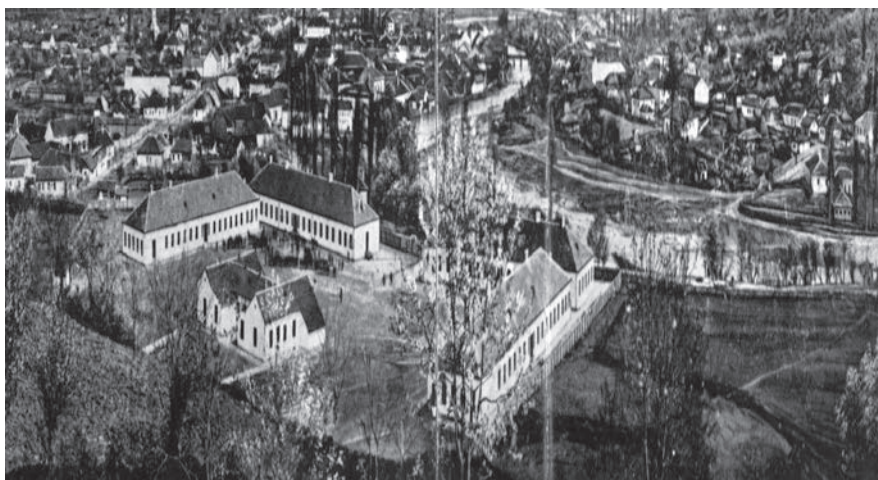
Касарна 17. њешадијској њука, Дринске дивизије у Ваљевоу 1905. године

још 1,5 динара по пореској глави. Одлука о накнадном прирезу, донета је од стране Начелства округа ваљевског 1885. године. 10