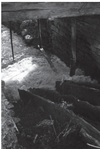
Слика 11. Вийло воденице, село Годљево