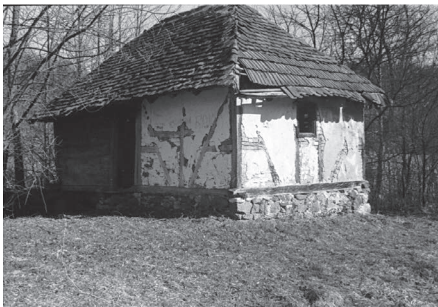
Слика 08. Воденица у селу Годљево