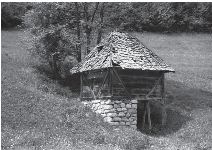
Слика 03. Воденица пошочара у селу Маковиштице