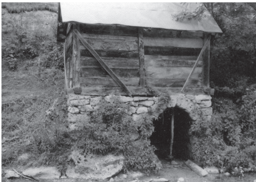
Слика 07. Воденица њојочара у селу Годечево