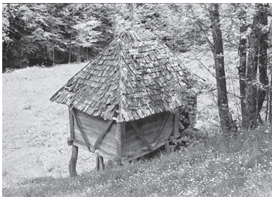
Слика 04. Воденица пошочара у селу Маковиштице