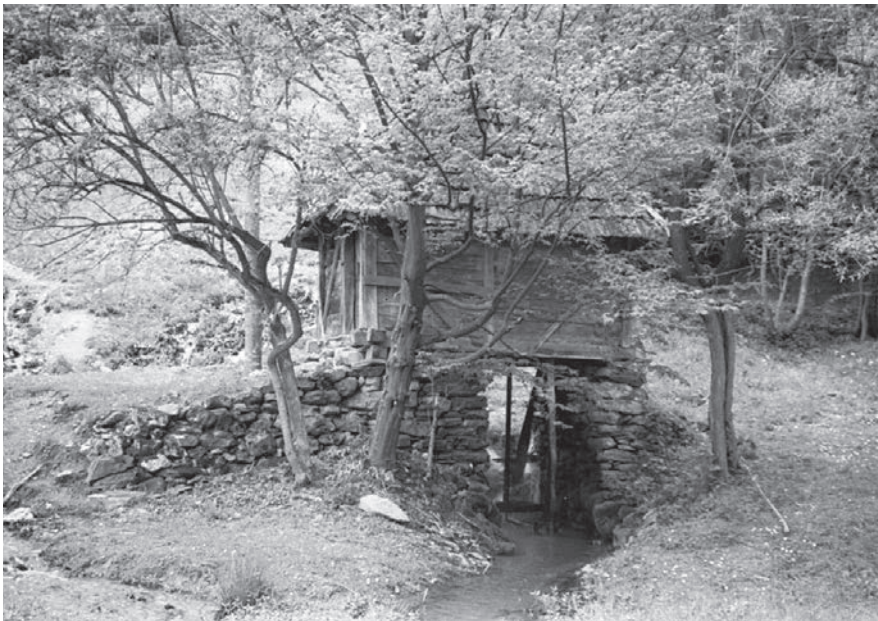
Слика 06. Воденица њојочара у селу Маковиштице