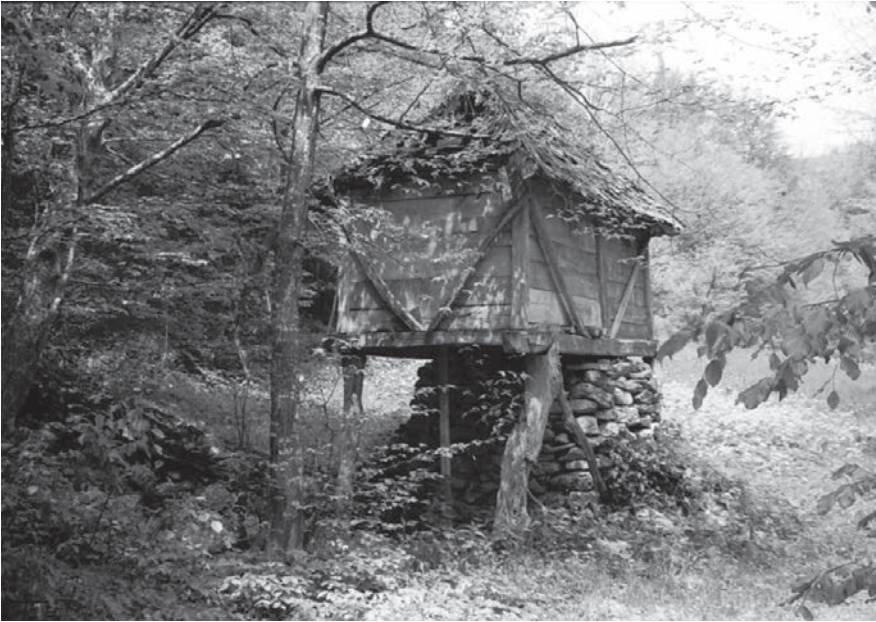
Слика 05. Воденица њојочара у селу Руда Буква