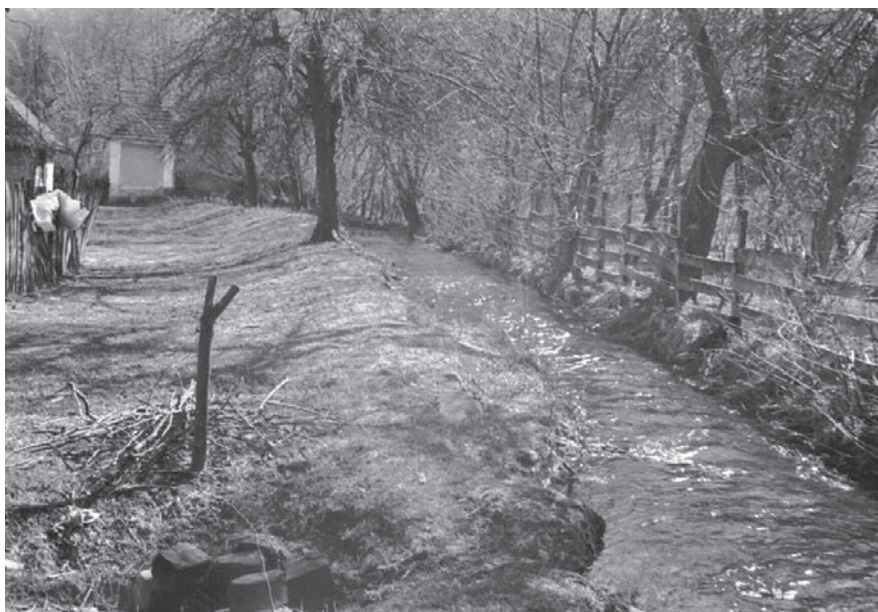
Слика 09. Јаз за довод воде до воденице село Годљево