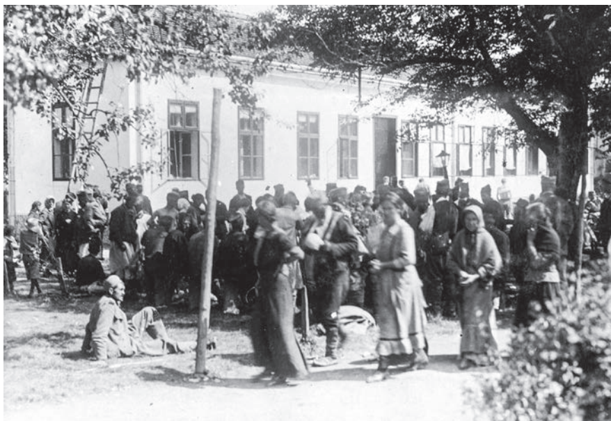
Двориште ваљевске војне болнице, са хируршким одељењем

„За болницу узета је кафана /.../. За интерно одељење служиле су две собе и једна соба за хируршко одељење. /.../ Доцније сазидана је једна мала зграда за хируршко одељење.“ (Аутобиографија)