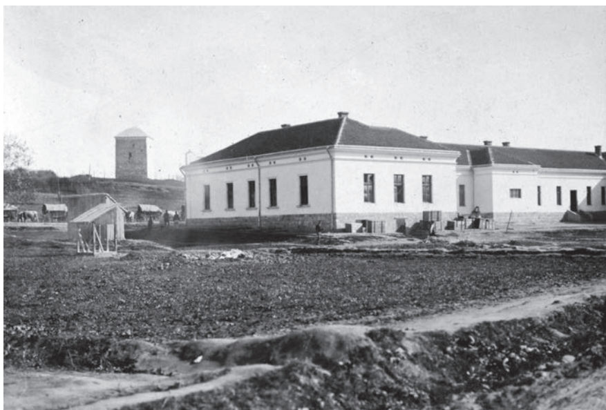
Касарна болничарске чете

„Дринска долничарска чета лепо је њроводила њод шаторима у лојору на левој страни њуша идући за касарну V њешад. њука. Шатори за војнике били су мали и ниски и њосве неудобни за становање. Ако је лепо кишно, онда је њежак животи у малим шаторима, зато сам се решио да долничарска чета њодиће себи зграду.“ (Аутобиографија)