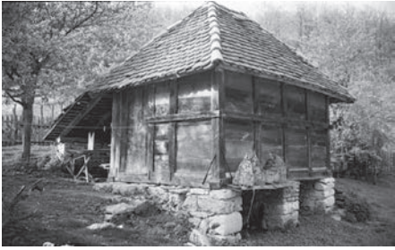
Слика 06. Мајаза, село Маковишће