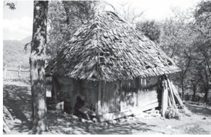
Слика 07. Мајаза са скелејом и испуном од шалии повезаних „на унизу”