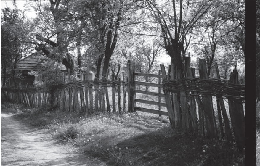
Слика 14. Ограда од „џрошћа“ и капија

тално равна по врху већ неједнаке дужине. Капија је од хоризонталних баскија повезаних на крајевима и средини вертикалним ступцима. Везује се за довратни стуб помоћу венца од прућа. [Слика 14]