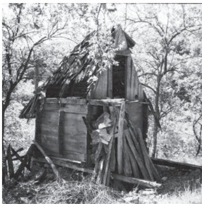
Слика 10. Амбар са њредњим њиремом њокривен шиндром из Годечева