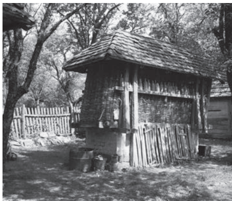
Слика 11. Кош са две њрује удвојених сѣубаца из Парамуна