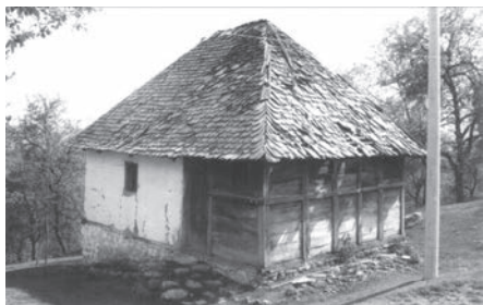
Слика 02. Полудрвнара-йолучаймара йокривена шиндром „на койийо“ из села Маковишије