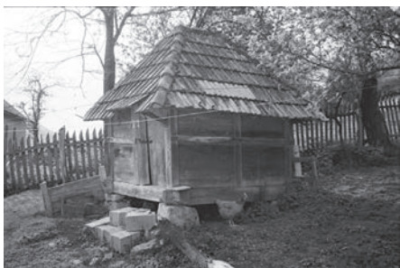
Слика 04. Вајай са скелетом и исйуном од тйалйи йовезаних „на унизу“