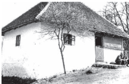
Слика 03. Полудрвнара-йолучаймара йокривена шиндром из села Рагановци