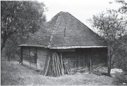
Слика 08. Качара, село Миошница