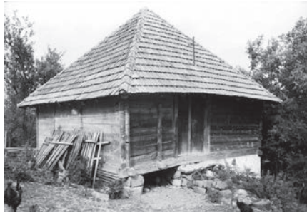
Слика 09. Качара, село Брајковићи

Амбар је објекат за чување жита који је настао као међуфаза између складиштења жита у кошевима у кровушту објекта и магазе. То је објекат са дубоким тремом ослоњеним на ступце. Ослоњен је на четири до шест камена тесаника на угловима и средини волумена. Корпус објекта је од хоризонталних талпи повезаних „на ћерџи“ како су начињени и пресејци. По дну и по врху су постављене хоризонталне греде које повезују конструкцију у једну целину. Приступ у унутрашњост је преко забата. Кров је на четири воде, покривач је дрвена шиндра. [Слика 10]