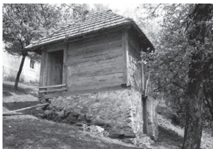
Слика 05. Вајай са скелетом и исйуном „на унизу“ који се налази „на зиданој ћелици“

шашовцима. Кров је на четири воде покривен дибер црепом у једноредом слогу. Грбине су покривене ћерамидом. [Слика 06]