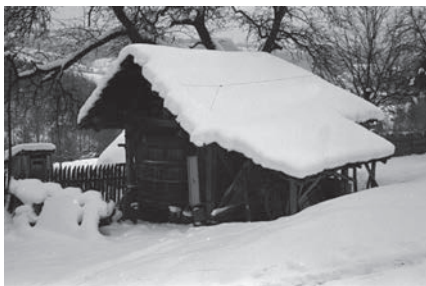
Слика 12. Наслон за кола заједно са надсѣрешицом за каѣе за шљиву