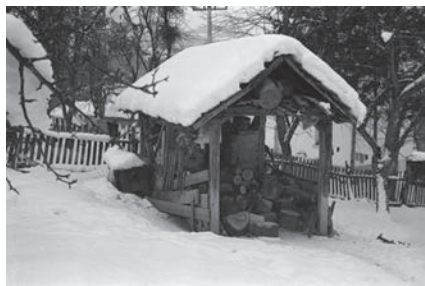
Слика 13. Фуруна

ји од стубаца са хоризонталном венчаницом повезаних помоћу кратких косника. кров је на три воде покривен са бибер црепом и слемомом са ћерамидом. [Слика 12]