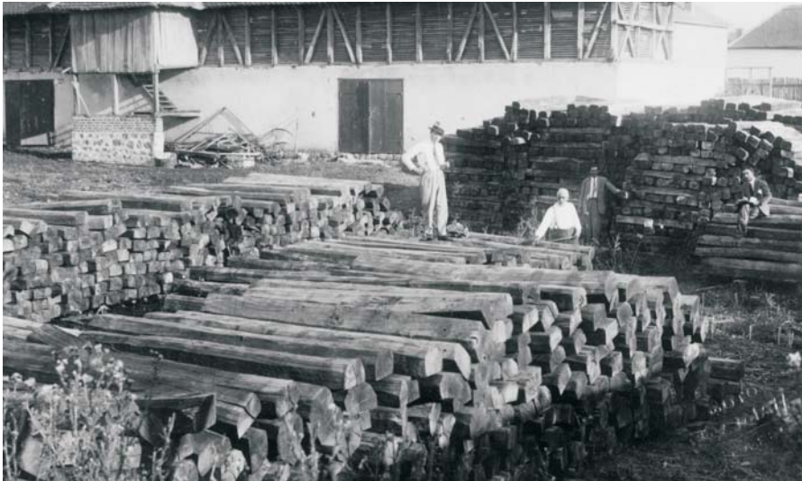
Грађа за потпаљивање високе пећи циглане