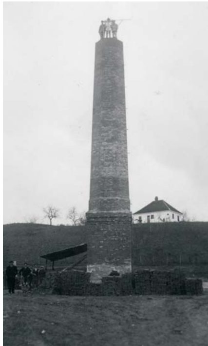
Подизање димњака циглане