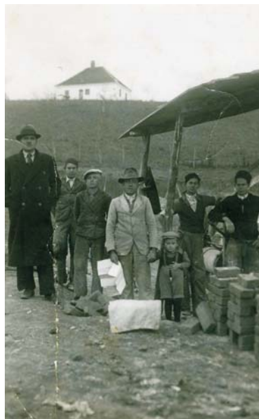
Радници који су градили циглану 1939–1940.