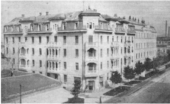
Нова зграда Друштва Светог Саве у Београду

Биран је на разне функције у Друштву Светог Саве и извршавао бројне и разноврсне послове. Тако је, на пример, као члан Главног одбора овог друштва потписао проглас Србима, Хрватима и Словенцима 22. фебруара 1920. године. Проглас је упућен под називом „Браћо Срби, Хрвати и Словенци!“ испод којег стоји поклич „Брат је мио, које вере био“. 36 Поред тог Прогласа, који је упутио браћи Србима, Хрватима и Словенцима, Главни одбор је донео одлуку да се и лично дође у везу са управама сличних друштава по програму у браће Хрвата и Словенаца, са Друштвом Светог Мохора и Друштвом Светог Кирила и Методија