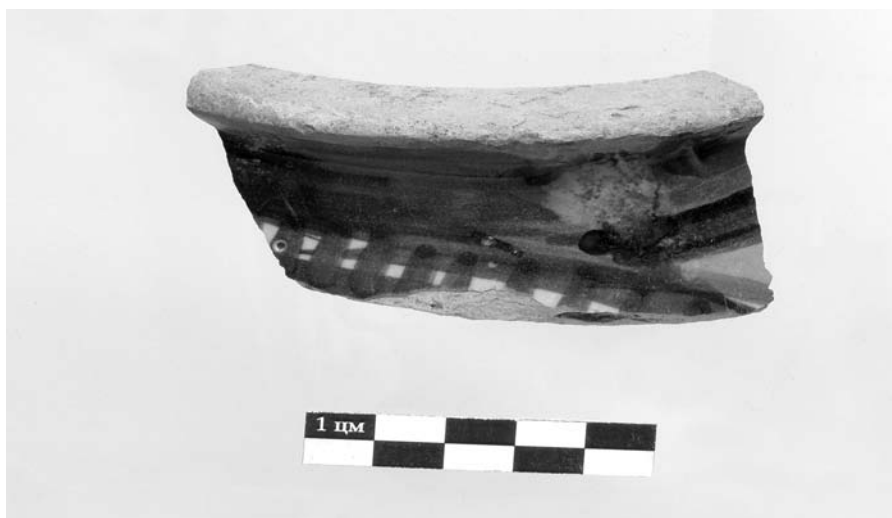
Сл. 4 – Део мајолике посуде из XV века