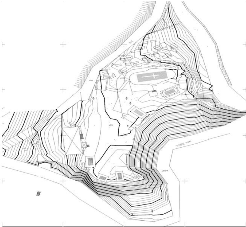
Сл. 1 – Ситуациони план платоа манастира Грачаница са црквом и пратећим објектима из 2011 године

Манастир Грачаница налази се у селу Тубравић, двадесетак километара југозападно од Ваљева и свега неколико километара од данашњег пута Ваљево – Бајина Башта. Храм посвећен Арханђелу Михајлу смештен је десној обали реке Сушице, на једном проширењу кањона, у коју се мало узводно улива Грачаничка река (сл. 1).