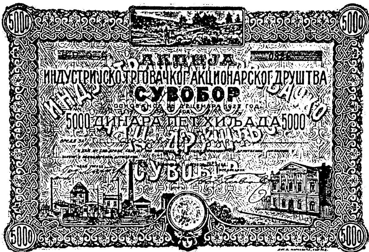
Акција А. Д. „Суворор” – Обреновац, 1923. године