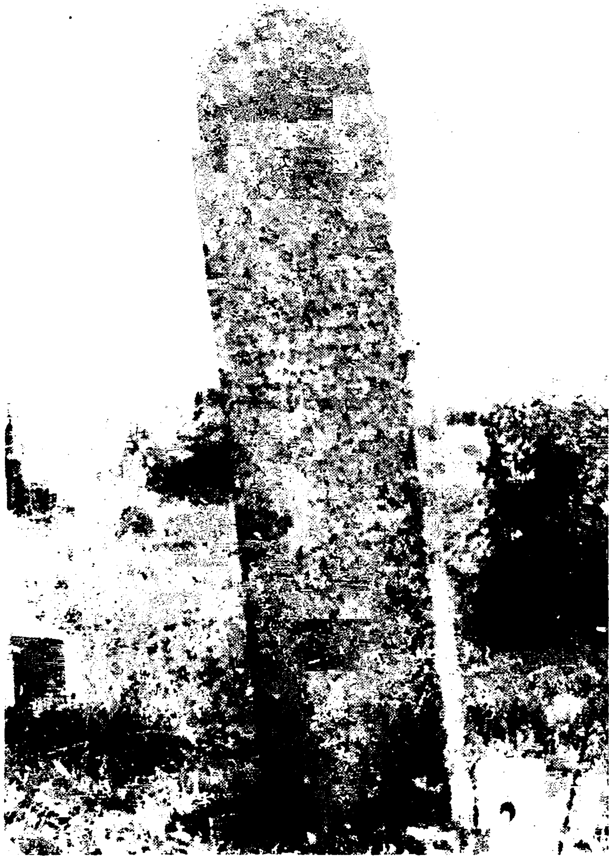
Споменик Петру Ђурђевићу Ракарцу на ракарском гробљу