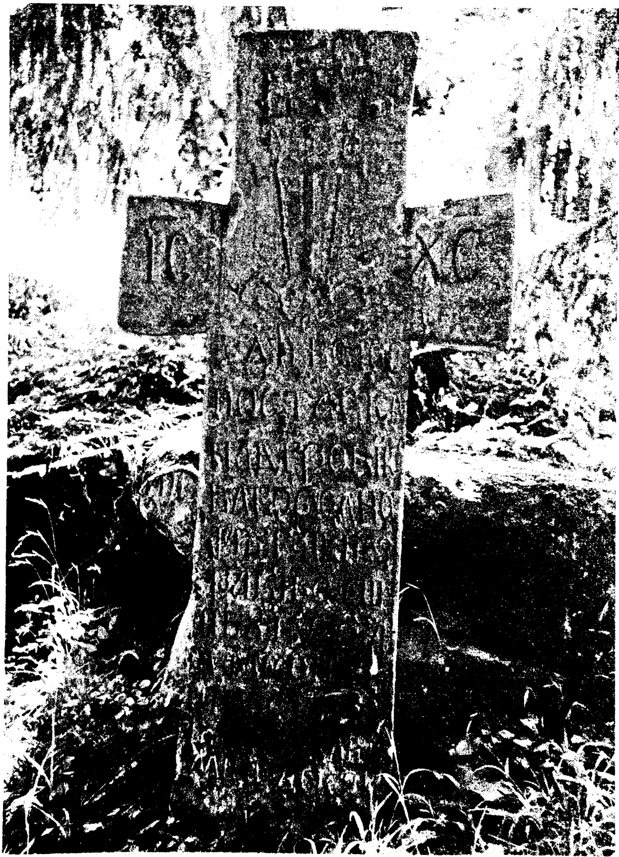
Надгробни споменик Раке Тешића у Рибници