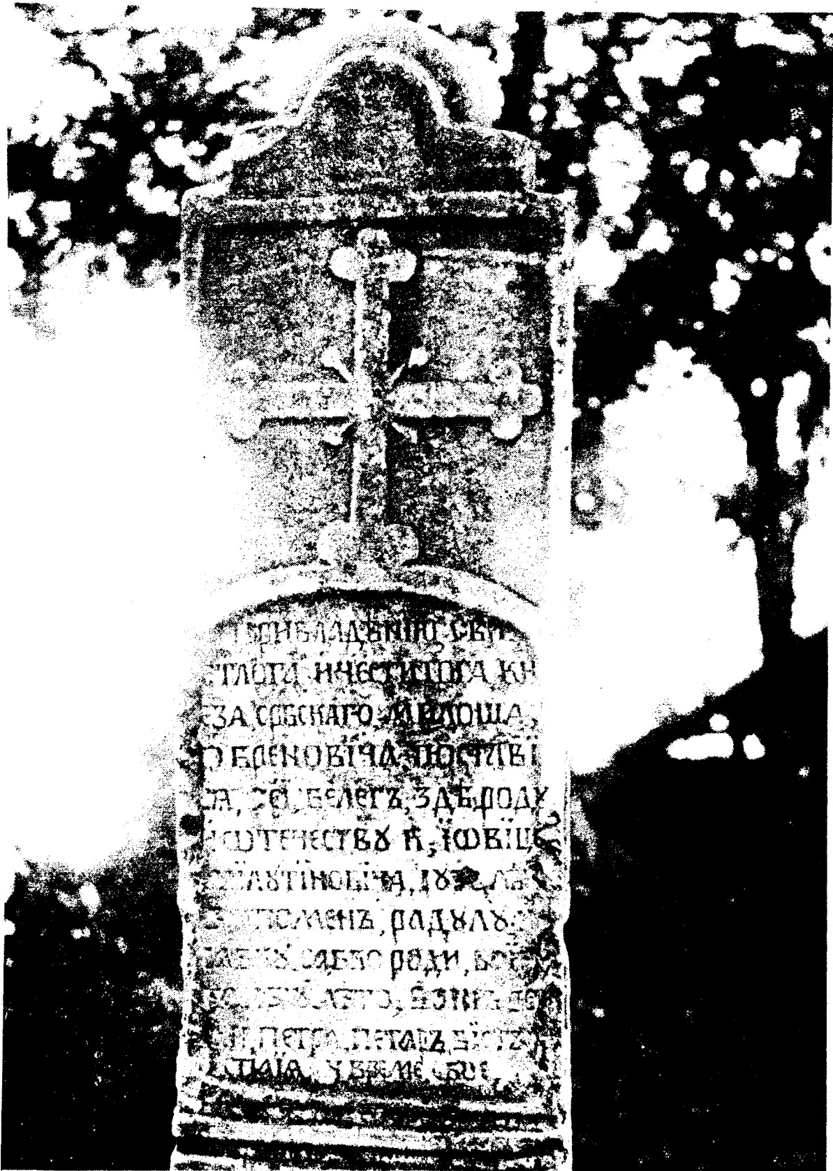
Белег Јовице Милутиновића у Санковићу

Обреновича, постави сја овај белег, овде роду и отечеству кнез Јовице