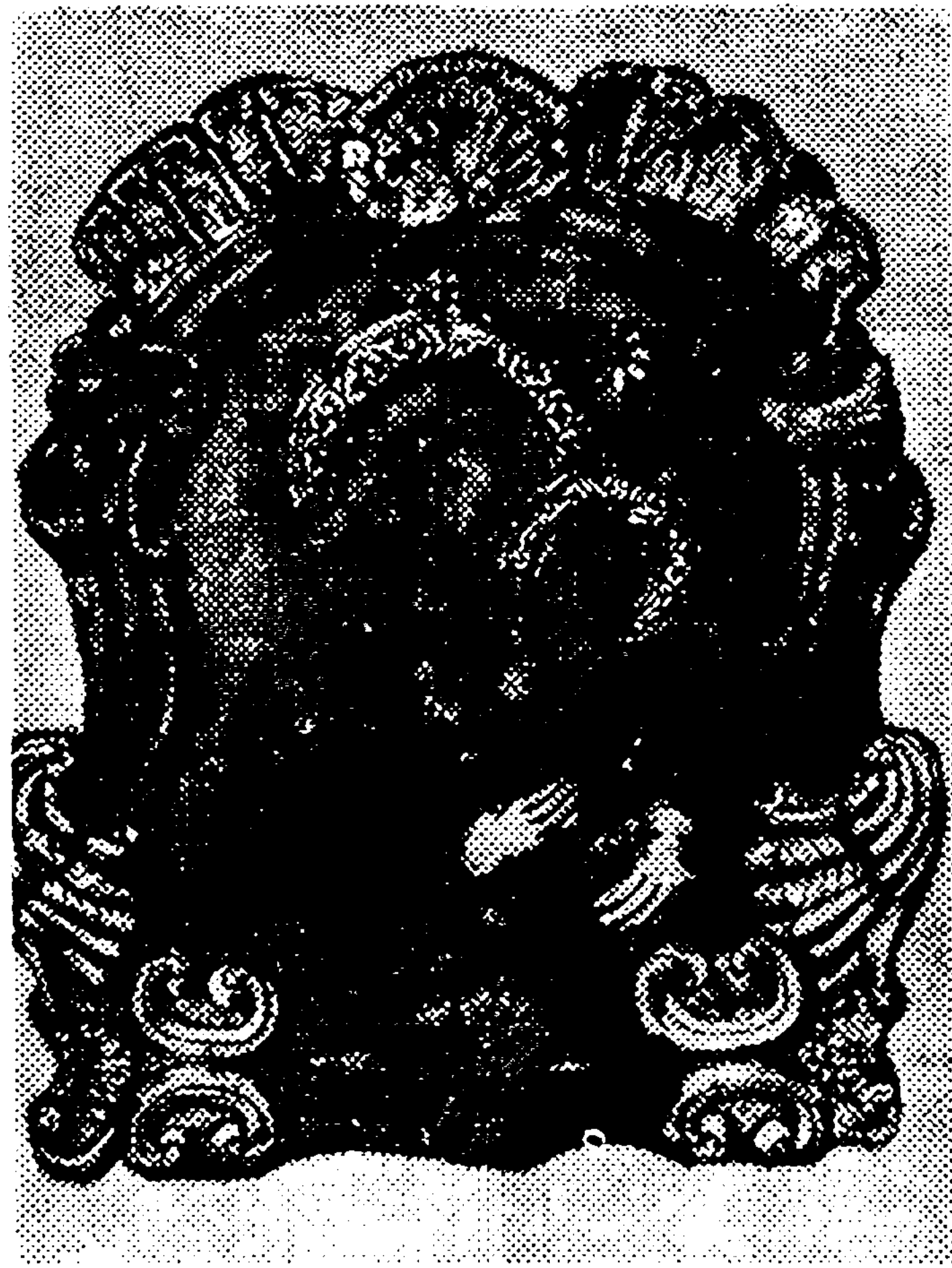
Теодор Стефанов Ваљевац, „Богородица са Христом“ (1761)