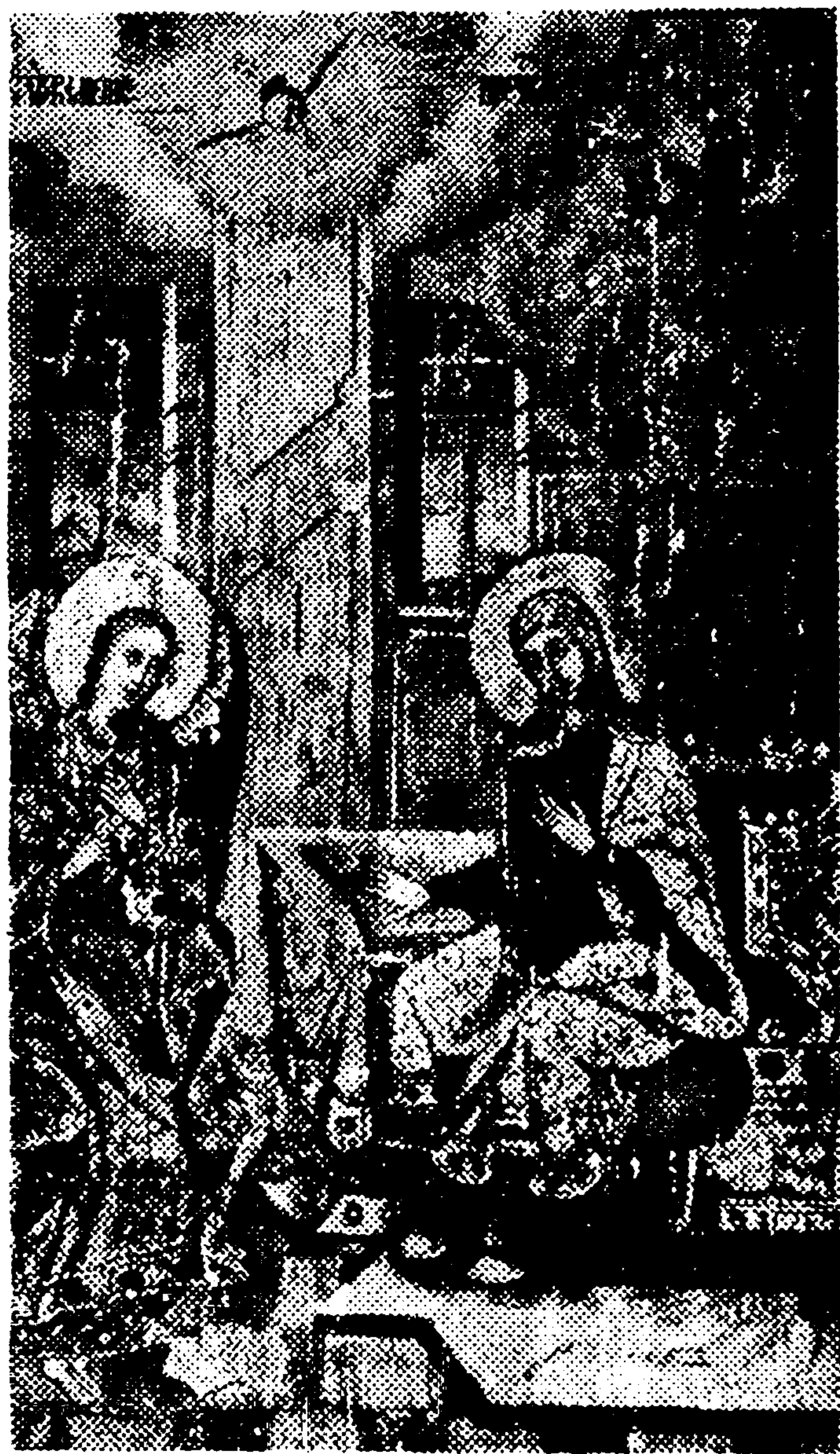
Теодор Стефанов, „Благовести“ (1753), Галерија Матице српске у Новом Саду