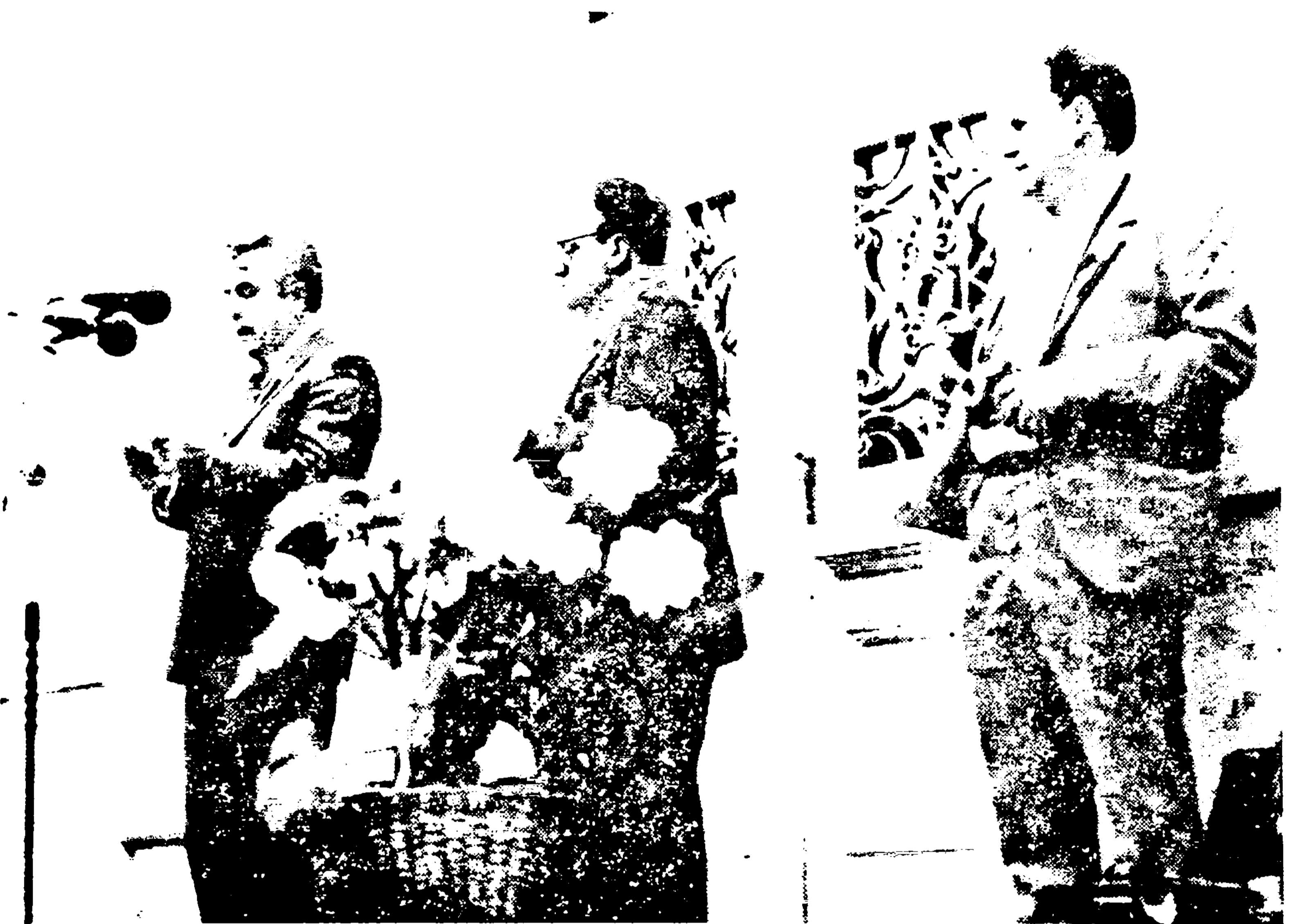
ПРЕДСЕДНИК СО ВАЉЕВО СРЕТЕН ЈАНКОВИЋ ГОВОРИ НА СВЕЧАНОМ ОТВАРАЊУ НОВЕ ЗГРАДЕ АРХИВА

Од свог оснивања пре 28 година Историјски архив Ваљева се развио, од врло мале институције у установу у којој се чува 200 архивских фондова и збирки, међу којима су веома значајни фондови из области управе, правосуђа и школства из прошлог и прве половине овог века. Радећи у отежаним смештајним условима Архив је успео да сачува и среди 4/5 од