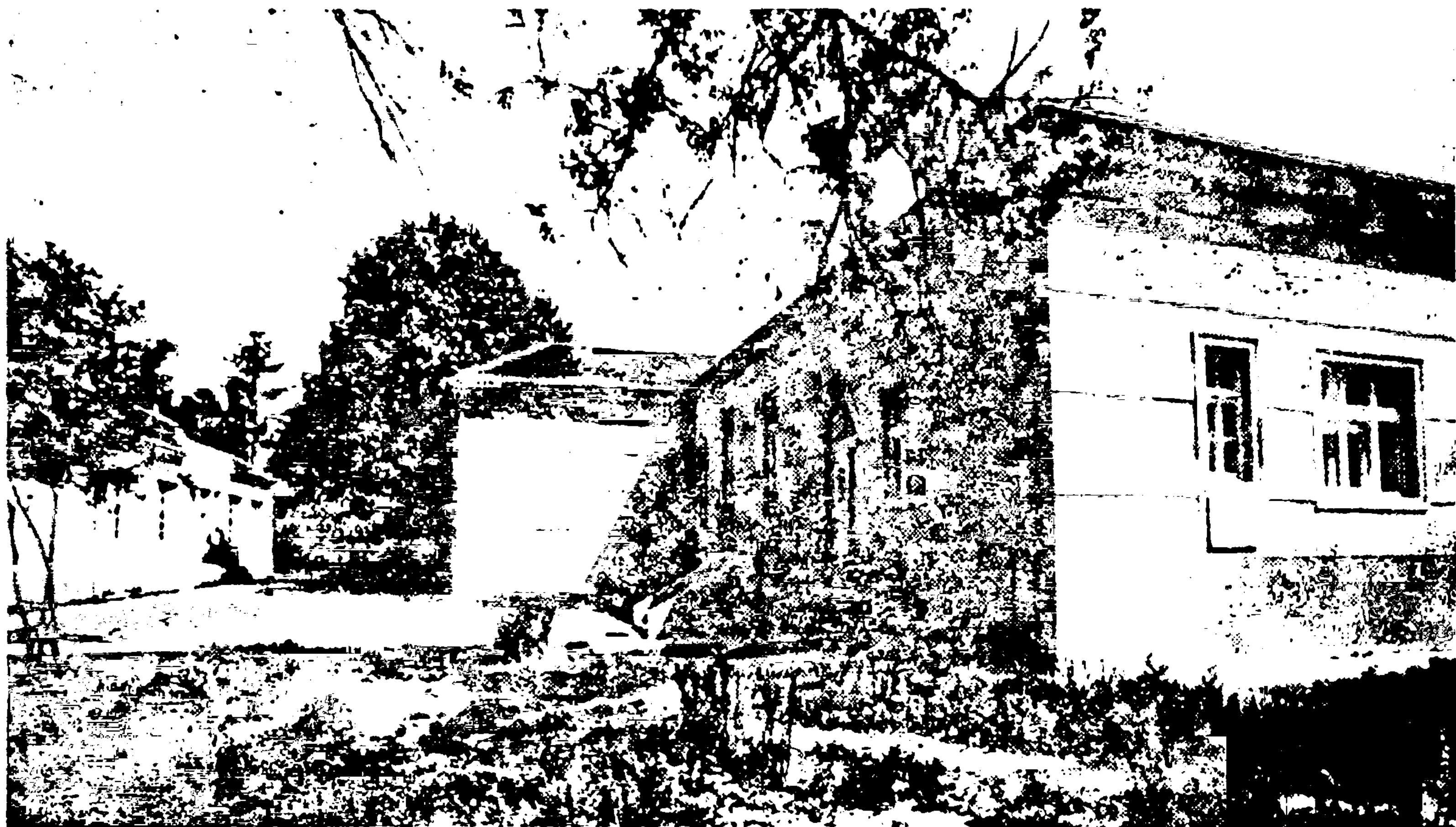
НОВА ЗГРАДА ИСТОРИЈСКОГ АРХИВА

Осећам велико задовољство и пријатну дужност што могу, отварајући ову данашњу свечаност, да у име радног колектива Међуопштинског историјског архива Ваљево поздравим све присутне госте — друштвено-политичке раднике, и научне раднике, представнике самоуправних интересних заједница културе и образовања, и других привредних, просветних и културних организација са територије колубарско-подрињског региона.